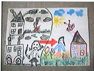
Przedszkole Publiczne w Leśnicy Oddział Zamiejskowy w Kadłubcu

Sfinansowano nagrody dla laureatów konkursu koszt: 250,00 zł.