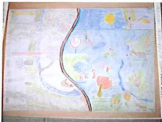
Przedszkole Publiczne w Leśnicy Oddział Zamiejskowy w Dolnej